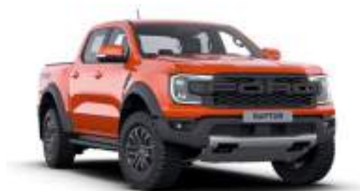
CODE ORANGE - lakier metalizowany 3 200 zł