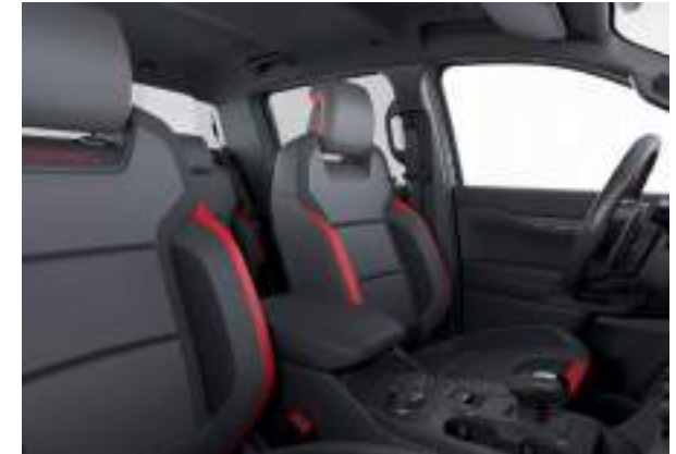
Ford Ranger® w wersji Raptor w kolorze Blue Lightning (wymaga dopłaty) Wnętrze: Tapicerka skórzana w stylizacji Raptor (wyposażenie standardowe)