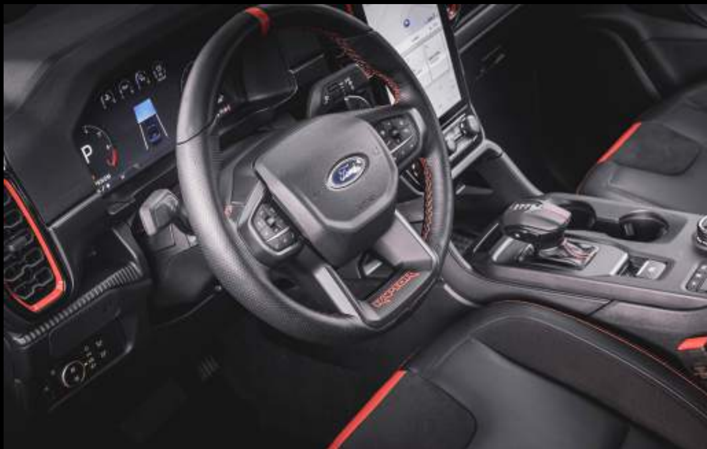
Ford Ranger w wersji Raptor z opcjonalnym wyposażeniem