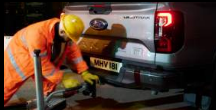
Maksymalna masa ciągniętej przyczepy to aż 3500 kg

Wyposażenie standardowe wersji Limited, Wildtrak i Platinum