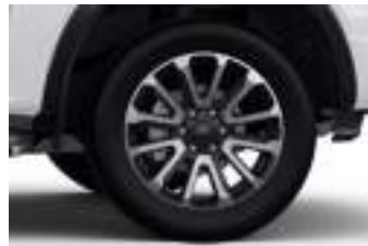
20" obrycze kół ze stopów lekkich (D2FCC) PLATINUM ECOBLUE