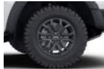
17" obrycze kół ze stopów lekkich (D2YDX) RAPTOR