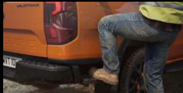
Stopień boczny w tylnym zderzaku

Wyposażenie standardowe wersji Limited, Wildtrak i Platinum