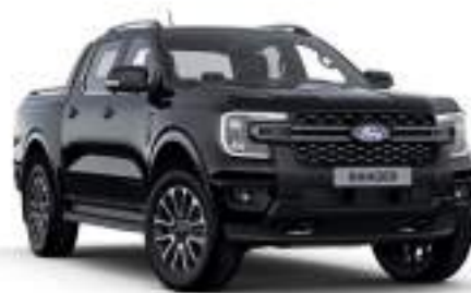
AGATE BLACK - lakier metalizowany 3 200 zł