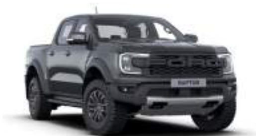
METEOR GREY - lakier metalizowany 3 200 zł