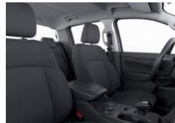
Ford Ranger® w wersji XLT (wersja z napędem PHEV) w kolorze Frozen White (bez dopłaty) Wnętrze: Tapicerka materiałowa (wyposażenie standardowe)