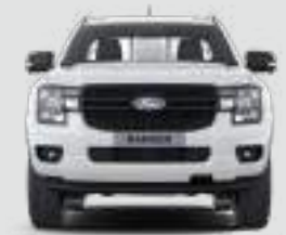
Szerokość całkowita z lusterkami bocznymi: 2208 mm