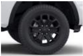
18" obrycze kół ze stopów lekkich (D2UFC) XLT ECOBLUE