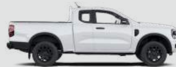
Przedłużona kabina Długość całkowita z lusterkami bocznymi: 5370 mm

Wszystkie wymiary podlegają tolerancjom produkcyjnym i odnoszą się do modeli z minimalnym wyposażeniem i nie obejmują żadnego wyposażenia. Wymiary wersji MS-RT dostępne u Twojego Dealera Ford.