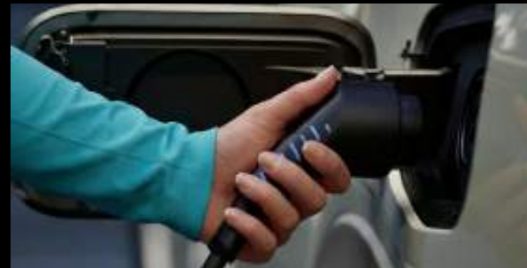
Maksymalny zasięg na silniku elektrycznym to 43 KM