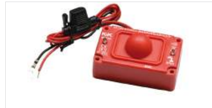
Odstraszacz do kun (2 033 207) 392 zł

Pełną gamę oryginalnych akcesoriów FORD znajdziesz na stronie www.akcesoria-ford.pl . Zapytaj również o aktualne promocje u Swojego Dealera FORDa. Podane ceny są cenami detalicznymi netto. Nie zawierają kosztu montażu. Ceny aktualne na dzień publikacji cennika.