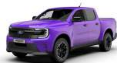
ENW PURPLE 3 700 zł