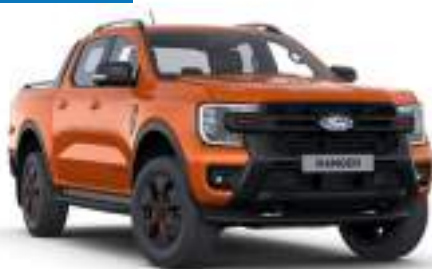
IGNITE ORANGE - lakier SPECJALNY 3 700 zł Lakier dostępny tylko dla wersji Wildtrak