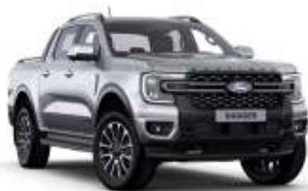
ICONIC SILVER - lakier specjalny 3 200 zł