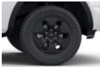
17" obrycze kół ze stopów lekkich (D2YF2) XLT PHEV