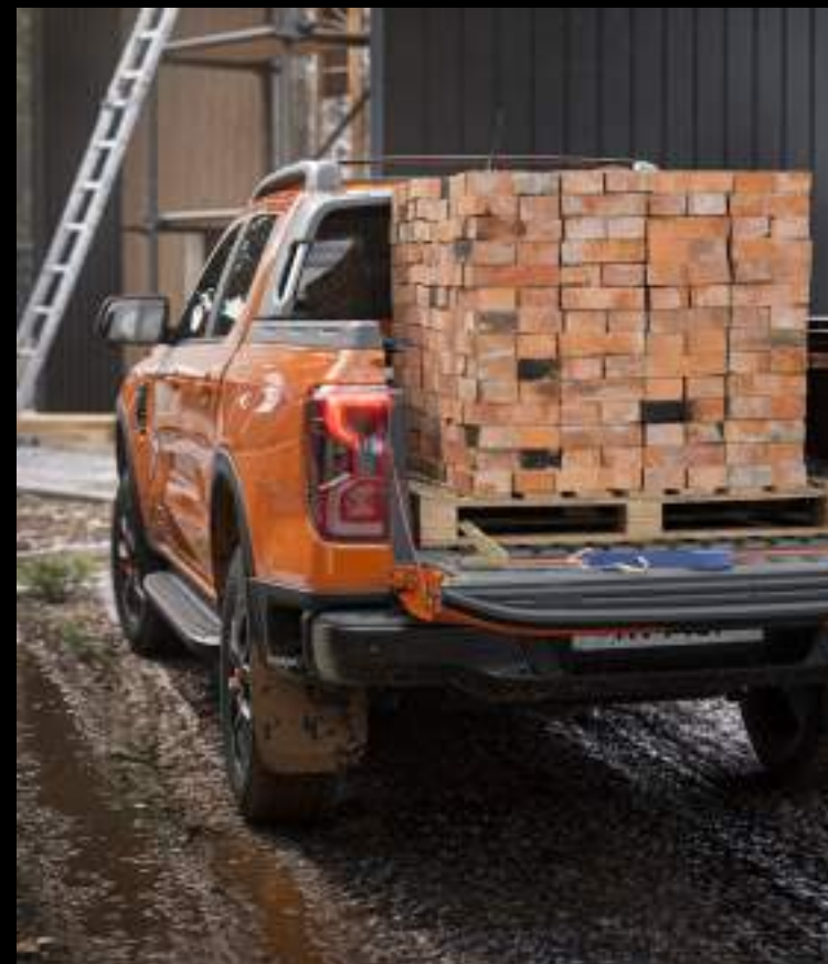
Maksymalna ładowność to 1060 kg dla wersji Limited