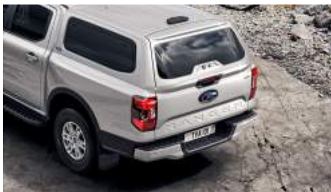
Hardtop z oknami w trzech kolorach nadwozia 17 200 zł dla wszystkich wersji w wyjątkiem wersji MS-RT i Raptor W kolorze nadwozia dla kolorów: Frozen White, Carbonized Grey, Agate Black. Dla pozostałych kolorów nadwozia Hardtop w kolorze czarnym Agate Black.