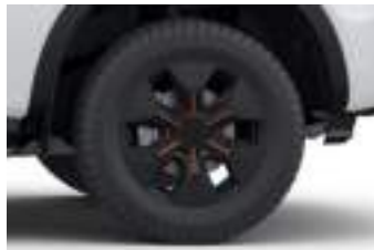
18" obrycze kół ze stopów lekkich (D2UA1) WILDTRAK PHEV