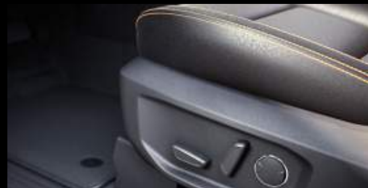
Elektryczna regulacja foteli Wyposażenie standardowe dla wybranych wersji