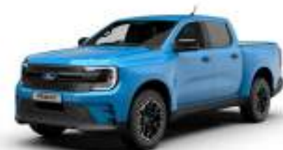
MS-RT BLUE 3 700 zł