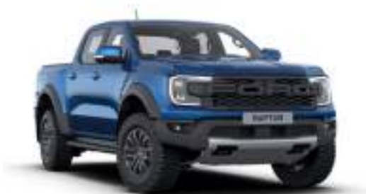
BLUE LIGHTNING - lakier metalizowany 3 200 zł