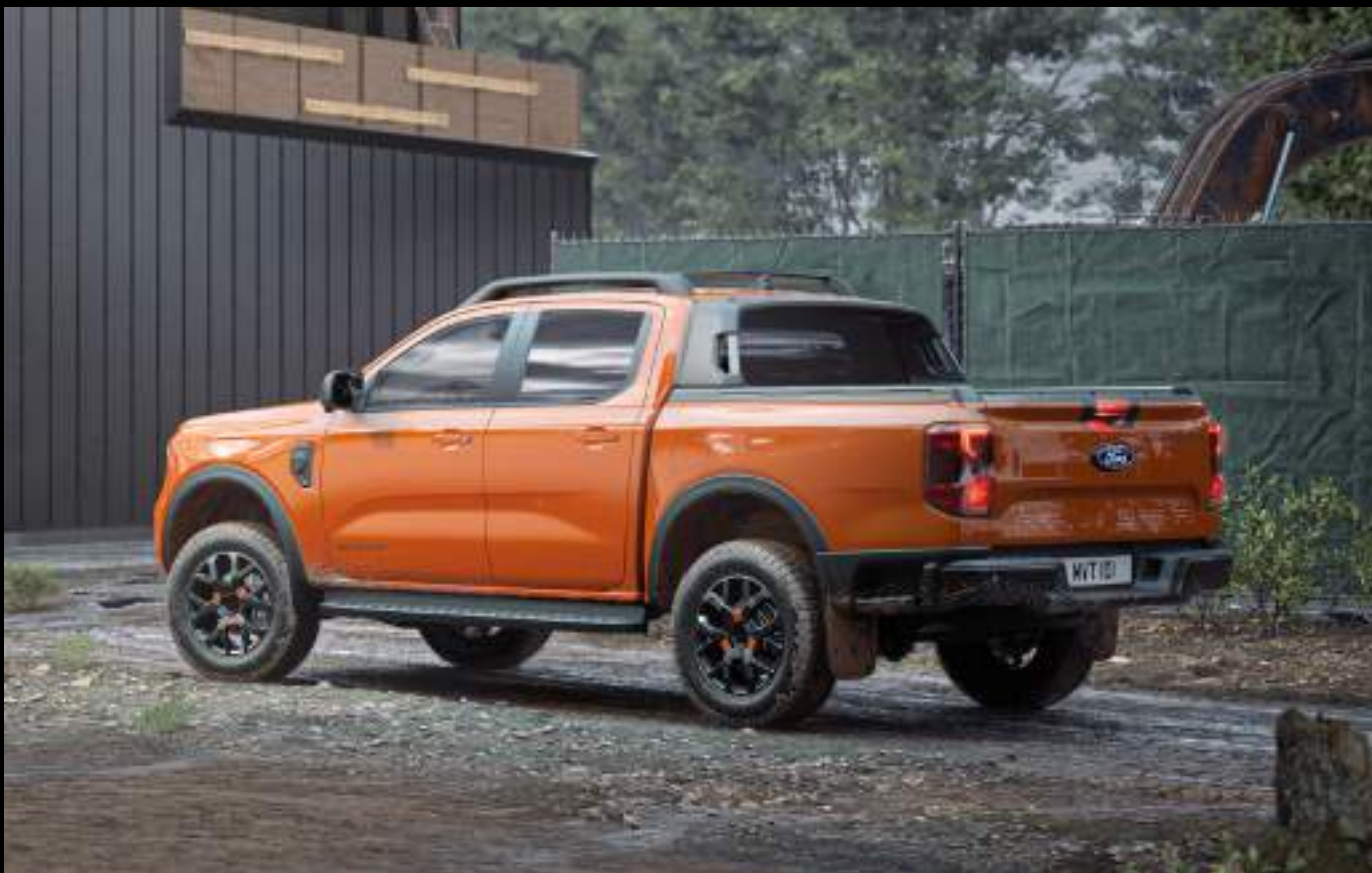
Ford Ranger® w wersji Wildtrak z silnikiem 3.0 EcoBlue V6. Kolor nadwozia: Ignite Orange (wymaga dopłaty)

Najnowszy silnik wysokoprężny V6 3.0 EcoBlue oferuje aż do 240 koni mechanicznych i generuje do 600 Nm momentu obrotowego, a poszerzone nadwozie nadaje Rangerowi większej stabilności w terenie oraz podczas wożenia ładunku, jak i jeszcze bardziej wyrazistego wyglądu. Szersza skrzynia ładunkowa zapewnia dodatkową przestrzeń ładunkową, pozwalającą zmieścić standardową europaletę pomiędzy nadkolami. Skrzynia została wykończona nową, wyprofilowaną wykładziną zapewniającą jej lepszą ochronę przed uszkodzeniami.