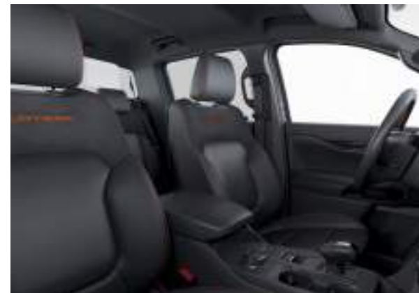
Ford Ranger® w wersji Wildtrak (wersja z silnikiem EcoBlue) w kolorze Ignite Orange (wymaga dopłaty) Wnętrze: Tapicerka częściowo skórzana w stylizacji Wildtrak (wyposażenie standardowe)