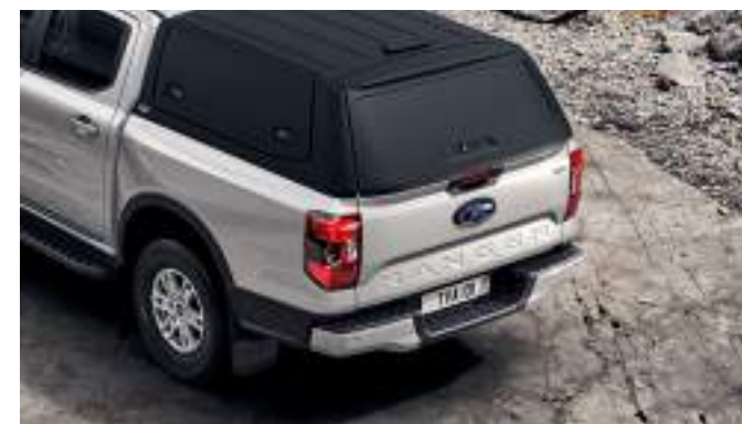
Hardtop bez okiem w kolorze „czarny mat” 16 200 zł dla wszystkich wersji w wyjątkiem wersji MS-RT i Raptor