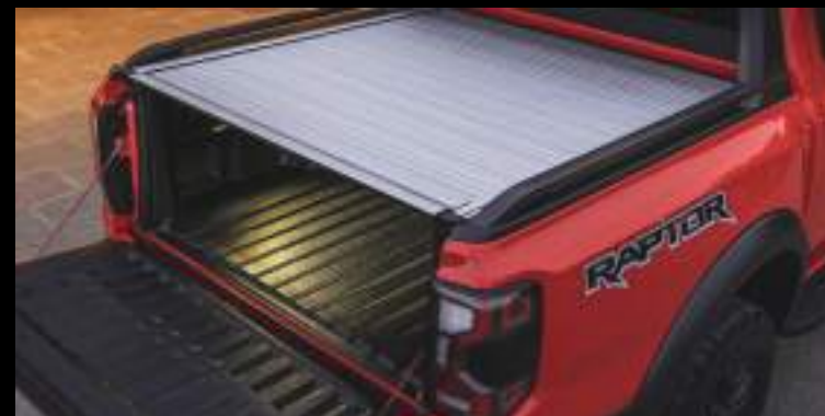
Elektryczna roleta - wymaga dopłaty