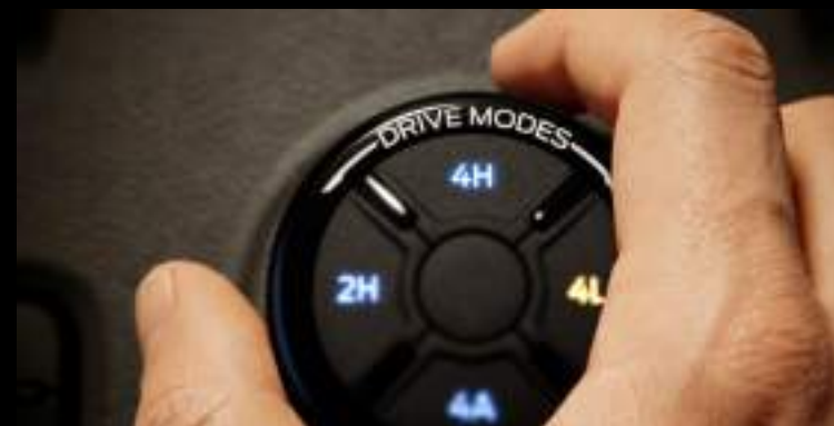
Pokrętko wyboru trybów jazdy Wyposażenie standardowe dla wszystkich wersji