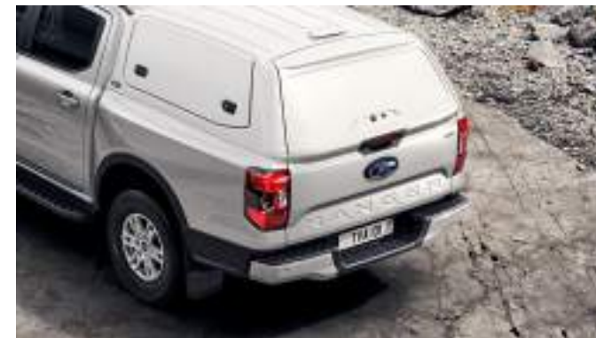
Hardtop bez okiem w kolorze białym 13 200 zł dla wszystkich wersji w wyjątkiem wersji MS-RT i Raptor