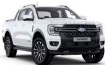
FROZEN WHITE - lakier zwykły bez dopłaty