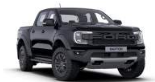
ABSOLUT BLACK - lakier metalizowany 3 200 zł