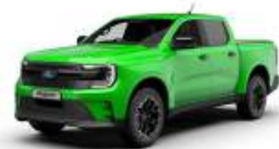
YELLOW GREEN 3 700 zł

Kolory SVO dostępne również dla innych wersji wyposażenia.