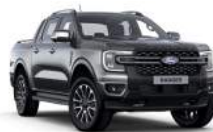
CARBONIZED GREY - lakier metalizowany 3 200 zł