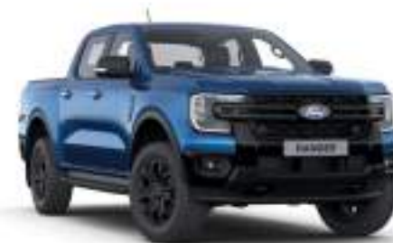
BLUE LIGHTNING - lakier metalizowany 3 200 zł Lakier dostępny tylko dla wersji XLT i Limited