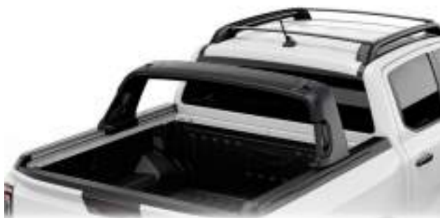
Flexible Rack System - funkcjonalny system mocowania ładunku 10 380 zł dla wersji Limited, Wildtrak, MS-RT