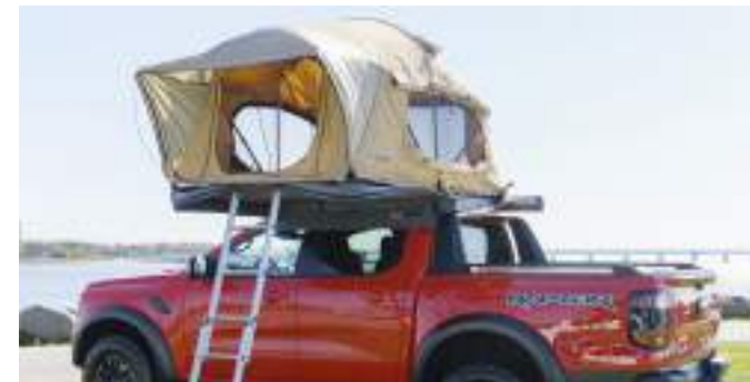
ARB* Namiot dachowy Flinders, z drabinką (2 616 022) 7 880 zł