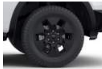
18" obrycze kół ze stopów lekkich (D2UA1) LIMITED PHEV