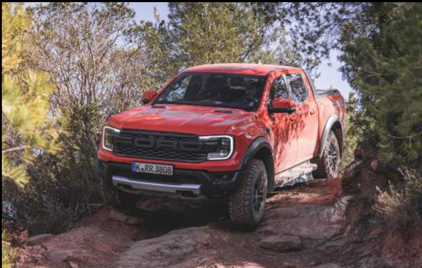
Ford Ranger w wersji Raptor z opcjonalnym wyposażeniem. Kolor nadwozia Code Orange - wymaga dopłaty

Jak przystało na produkt Ford Performance - Nowego Raptora z silnikiem benzynowym wyposażono w system Anti-Lag - jest on dostępny w trybie Baja i zapewnia szybszą reakcję na wciśnięcie pedału przyspieszenia podczas np. wyjścia z zakrętu lub podczas zmiany biegów.