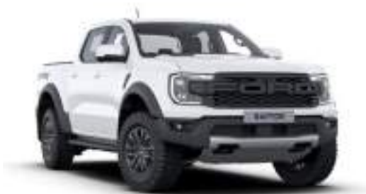
ARTCIC WHITE - lakier zwykły bez dopłaty