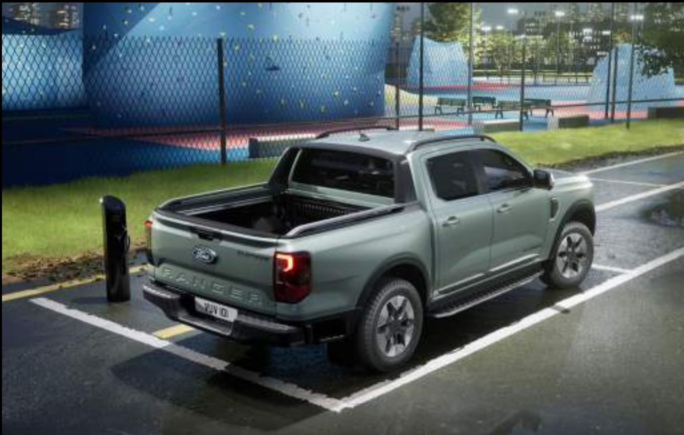
Ford Ranger w wersji Platinum z napędem PHEV. Kolor nadwozia Acacia Green (lakier dostępny tylko dla wersji Platinum - wymaga dopłaty)

Technologia hybrydowa w Fordzie Ranger pozwala na osiągnięcie zerowej emisji podczas jazdy w trybie elektrycznym EV Now. Najlepiej sprzedający się pick-up w Europie właśnie stał się jeszcze lepszy. Masz do dyspozycji bezkompromisową, kultową wytrzymałość i zdolność do ciężkiej pracy Forda Ranger.