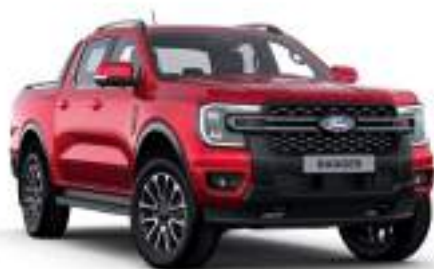
LUCID RED - lakier specjalny 3 700 zł Lakier niedostępny dla wersji Wildtrak, MS-RT