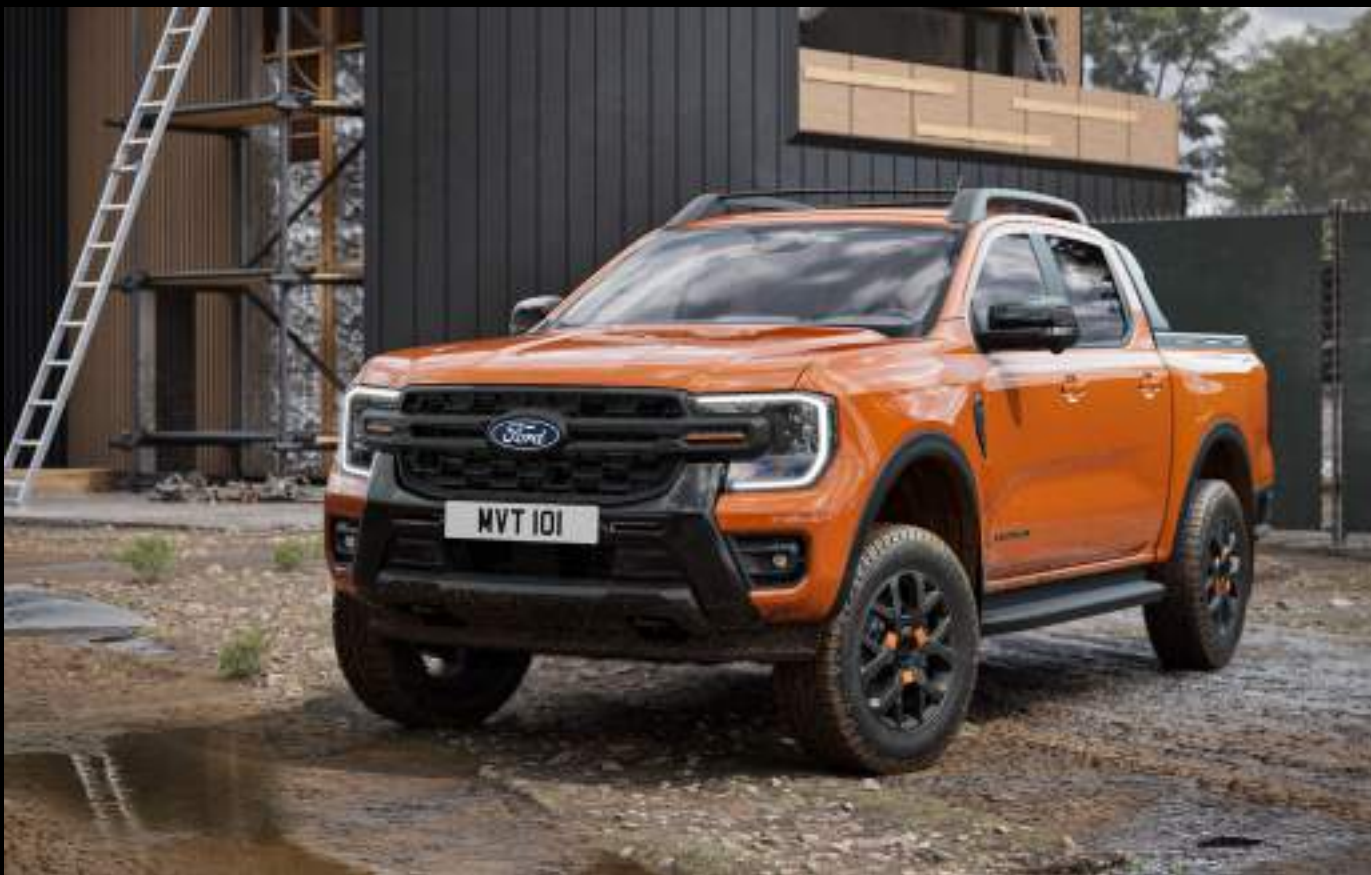
Ford Ranger® w wersji Wildtrak z silnikiem 3.0 EcoBlue V6. Kolor nadwozia: Ignite Orange (wymaga dopłaty)

Dostępny w sześciu wersjach wyposażenia: gotowej do pracy - XLT, kofortowej - LIMITED, przygodowej - WILDTRAK, ekskluzywnej - PLATINUM, sportowej - MS-RT oraz ekstermalnej - RAPTOR. Poznaj całą gamę Nowego Forda Ranger..