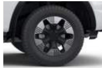
18" obrycze kół ze stopów lekkich (D2ULD) PLATINUM PHEV