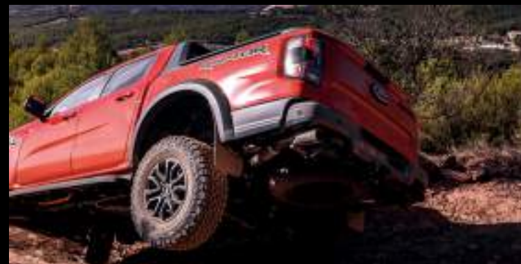
Opony terenowe AT - wyposażenie standardowe wersji Raptor