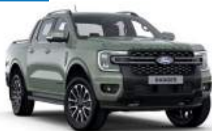
ACACIA GREEN - lakier specjalny 3 700 zł Lakier dostępny tylko dla wersji Platinum