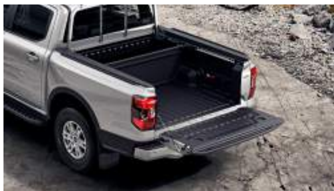
Ruchoma przegroda skrzyni ładunkowej 1 750 zł dla wszystkich wersji z wyjątkiem wersji Raptor