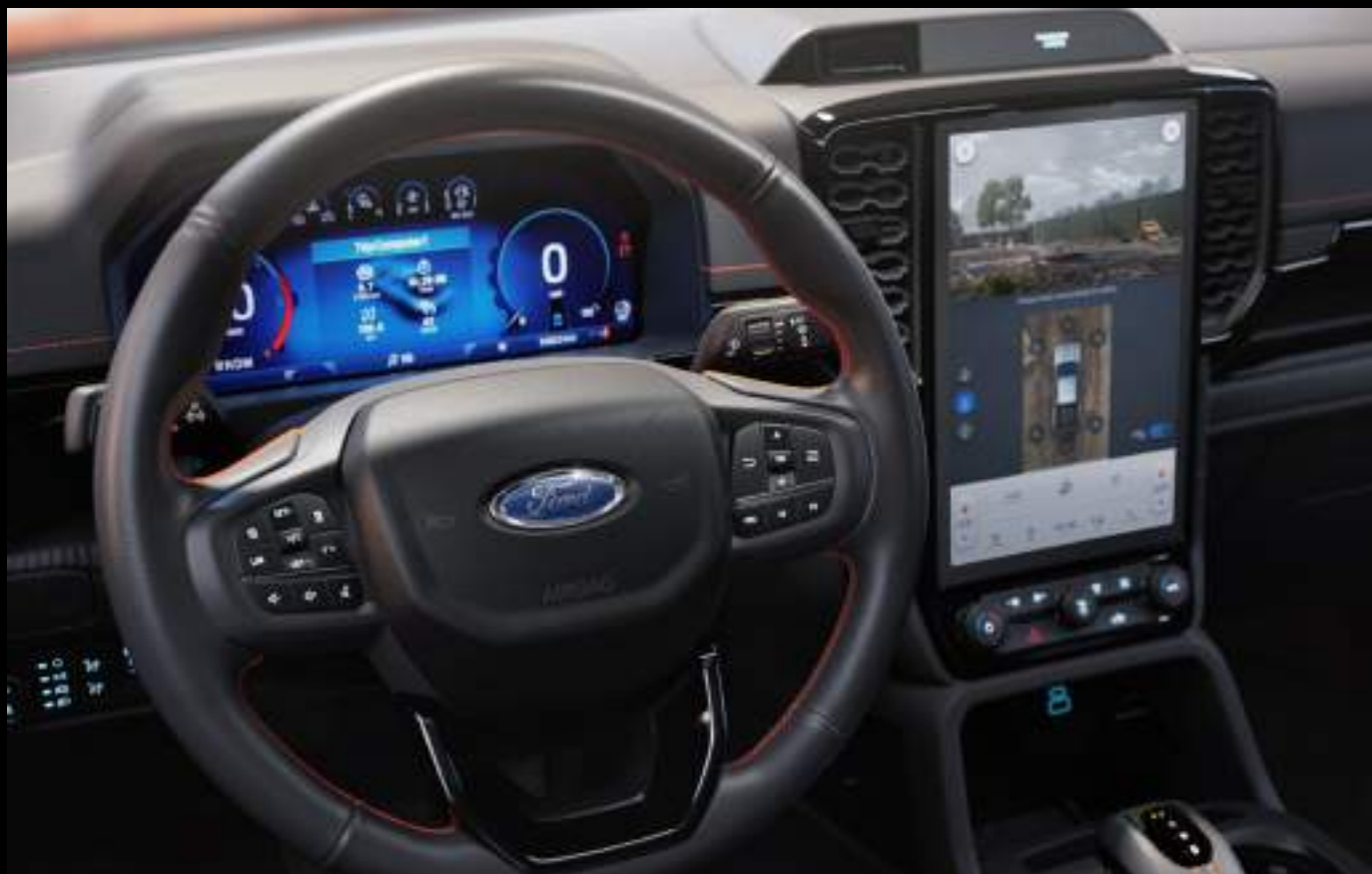
Ford Ranger Wildtrak z opcjonalnym wyposażeniem

System BlueCruise jest wyposażeniem standardowym dla wersji Platinum (PHEV) oraz opcjonalnym dla pozostałych wersji wyposażenia z napędem PHEV.