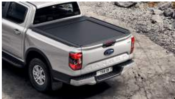
Aluminiowa roleta skrzyni ładunkowej 7 650 zł dla wszystkich wersji z wyjątkiem wersji Raptor