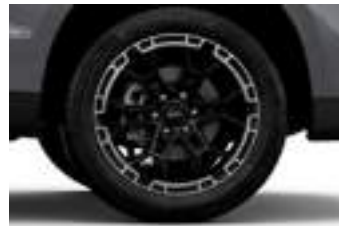
21" obrycze kół ze stopów lekkich MS-RT