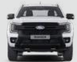
Szerokość całkowita z lusterkami bocznymi: 2208 mm