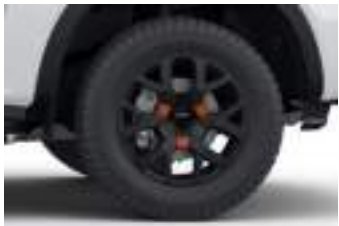
18" obrycze kół ze stopów lekkich (D2ULF) WILDTRAK ECOBLUE