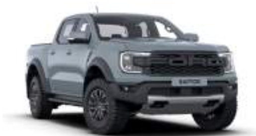
COMMAND GREY - lakier Performance 3 200 zł