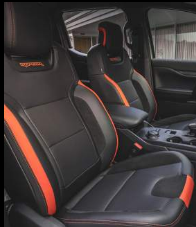
Tapicerka częściowo skórzana - wyposażenie standardowe wersji Raptor