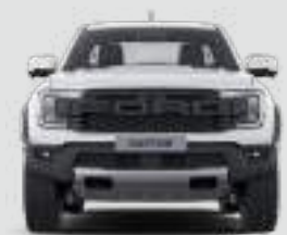
Szerokość całkowita z lusterkami bocznymi: 2208 mm