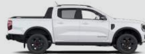
Podwójna kabina Długość całkowita z lusterkami bocznymi: 5370 mm