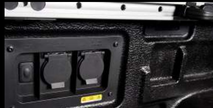
Power On Board - mobilne źródło zasilania (wymaga dopłaty)